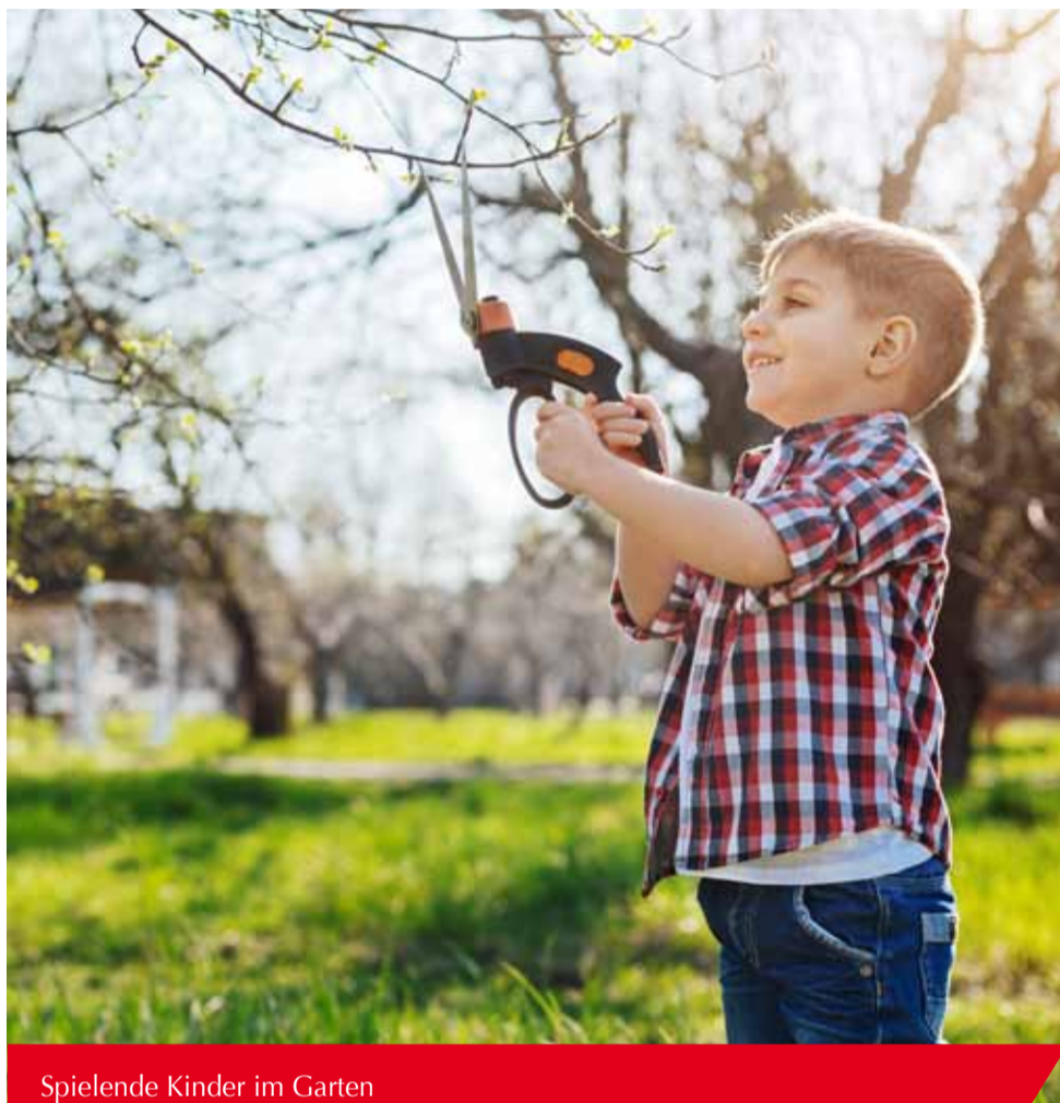
Spielende Kinder im Garten benötigen Aufsicht.

Das Gefahrenpotenzial von elektrischen und motorbetriebenen Gartengeräten sollte nicht unterschätzt werden. Bei elektrischen Gartengeräten sollten Sie nur Kabeltrommeln benützen, die auch zur Verwendung im Freien geeignet sind. Bei der Verwendung mancher Gartengeräte, wie z. B. Motorsensen, muss eine Schutzbrille getragen werden. Rasenmäher müssen grundsätzlich ausgeschaltet sein, wenn man in den Mähbereich greift. Gefahrenquellen im Garten sind zahlreich – Vorsicht ist geboten. Unglaublich, aber wahr – in Österreich verletzen sich rund 14.000 Personen bei der Gartenarbeit so schwer, dass eine Behandlung im Krankenhaus notwendig wird. Sollte trotz Ihrer Vorsichtsmaßnahmen dennoch etwas passieren, ist eine private Unfallversicherung unabdinglich, da die gesetzliche Unfallversicherung nur für die Folgen von Arbeitsunfällen zuständig ist.