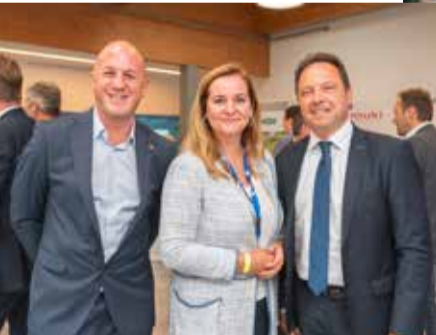
↑ Gute Laune in der Pause