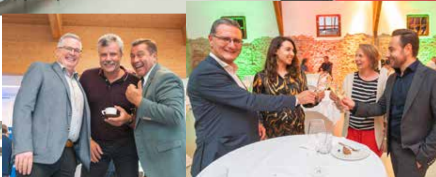
↑ Bei einem Kaffee plaudert es sich gut.