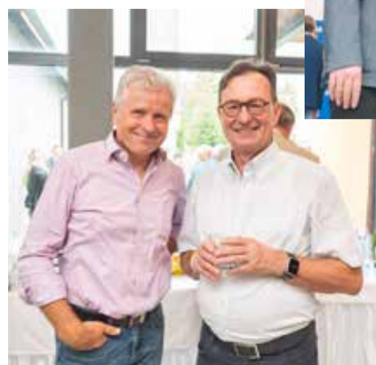
← Networking in der Pause