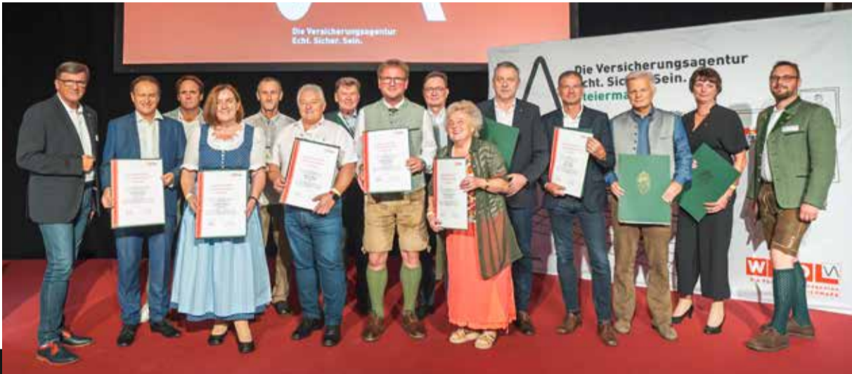
↑ Die geehrten Versicherungsagentinnen und Versicherungsagenten