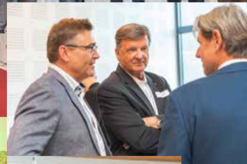
↑ Diskussionen unter Experten