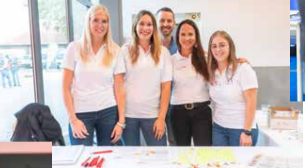
↓ Das Veranstaltungsteam der WKO