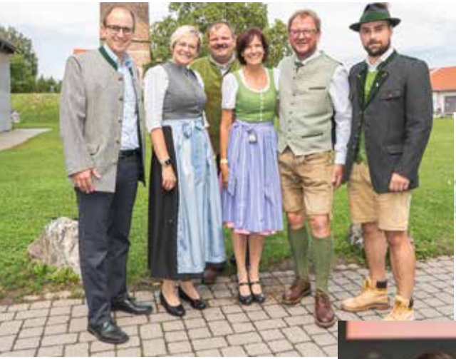
← Gute Stimmung vor dem Kongress