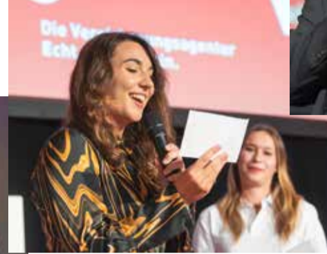
← ORF-Moderatorin Sandra Suppan