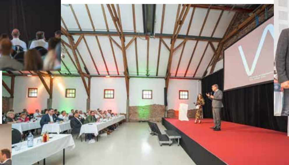
Stimmungsvolles Ambiente →