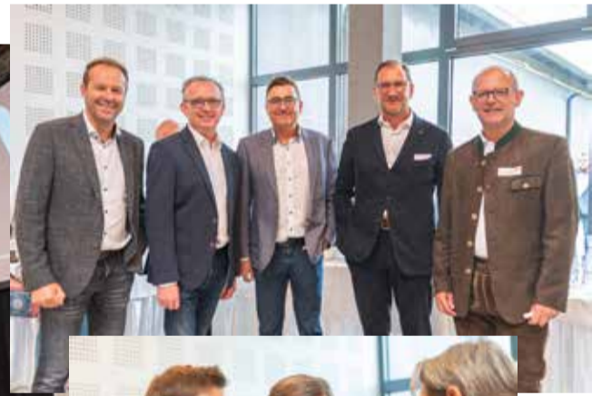
↑ Geballte Kompetenz